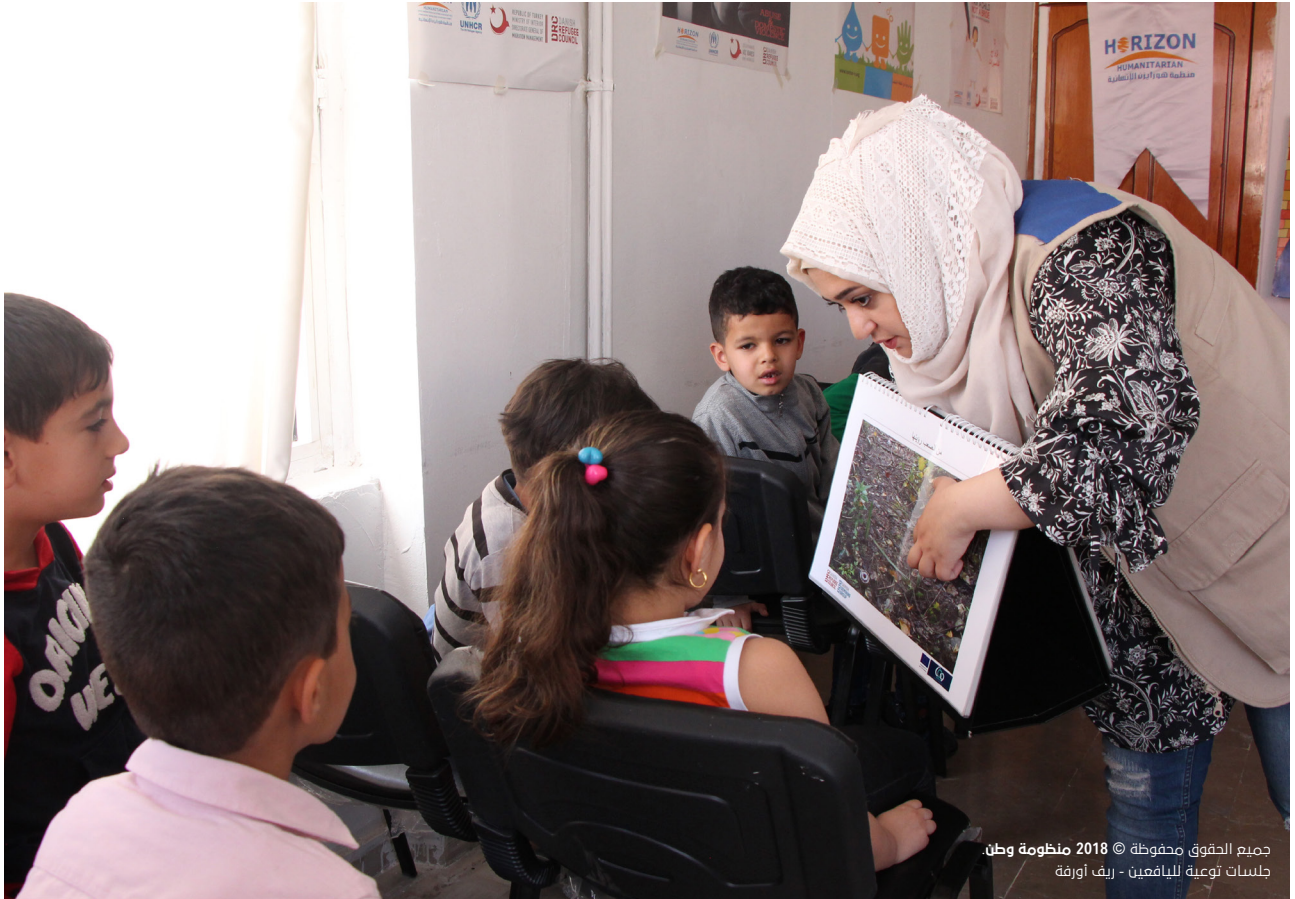
جميع الحقوق محفوظة © 2018 منظومة وطن. جلسات توعية للبايعين - ريف اورنة