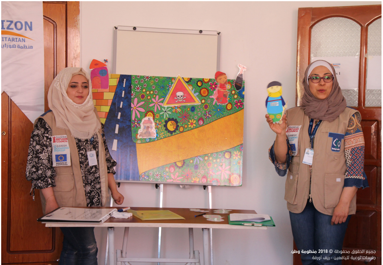
جلسات توعية للبايعين - ريف اورنة